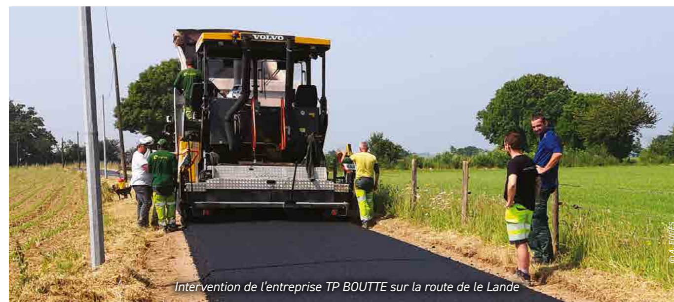
Intervention de l'entreprise TP BOUTTE sur la route de la Lande

9 places ont été aménagées pour les accueillir dans de bonnes conditions. Des bornes d'entrée et de sortie sont installées pour réguler l'usage de la plateforme et permettre le paiement de la prestation via un terminal bancaire.