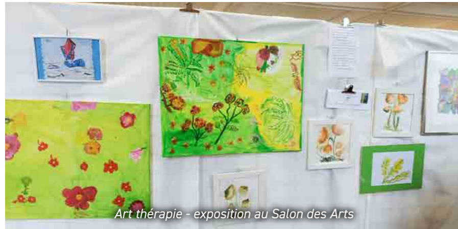
Art thérapie - exposition au Salon des Arts

Les 3 maîtresses de maison ont su être à l'écoute des résidents afin de proposer des activités et des animations permettant de créer une ambiance chaleureuse et conviviale.