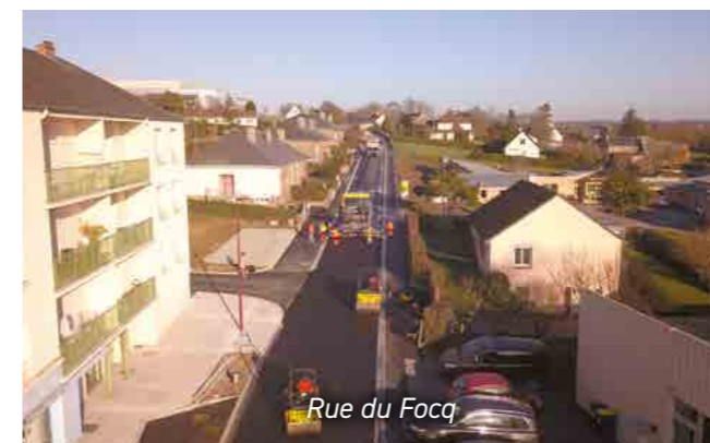
Rue du Focq

Cette belle rénovation a été réalisée au printemps 2023.