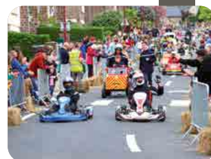
Course de caisses à savon p20