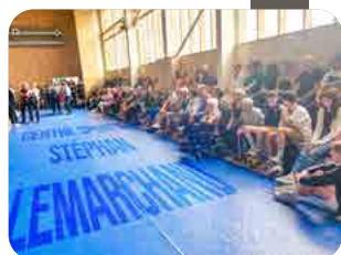
Inauguration du gymnase p 9