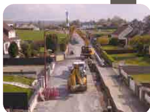
Travaux en cours et à venir p 6