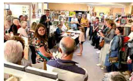
2023 : l'année des 30 ans de la médiathèque

L'historique de la bibliothèque jusqu'à l'appellation « médiathèque » en 1993 :