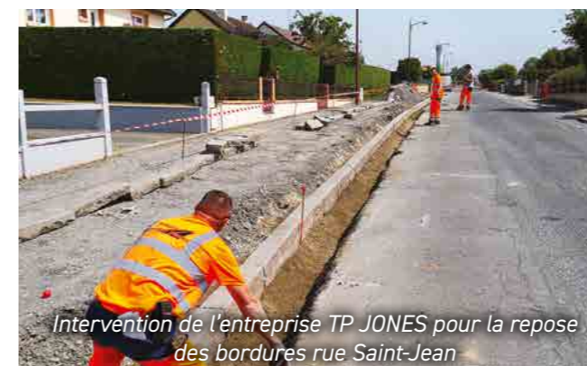
Intervention de l'entreprise TP JONES pour la repose des bordures rue Saint-Jean