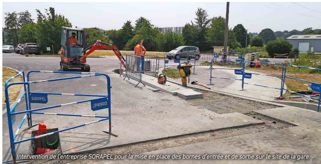
Intervention de l'entreprise SORAPEL pour la mise en place des bornes d'entrée et de sortie sur le site de la gare

Ce site est une compétence de la mairie mais la gestion, le fonctionnement et la maintenance font l'objet d'une convention de délégation de service avec la société CAMPING CAR PARK. Les travaux sont réalisés par l'entreprise SORAPEL de Cerisy-la-Forêt.